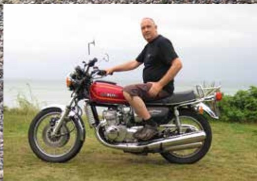
Suzuki GT50B - Suzuki' sidste var dansk