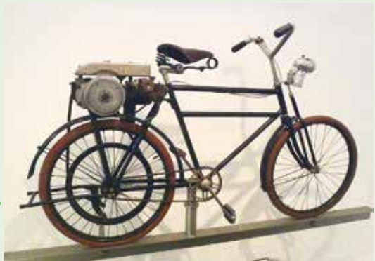
Samsø Tekniske Museum bliver ny attraktion på solskinsøen