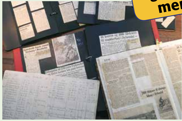
Gamle scrapbøger fortæller motorhistorie. Forfatteren er kommet i besiddelse af en kendt dansk motorkørers scrapbøger.