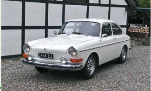
VW 1600 blev ikke helt den succes, man havde håbet. I dag er den blevet eftertragtet. Mød en glad ejer.

Næste nummer udkommer i kiosker den 4. maj 2017